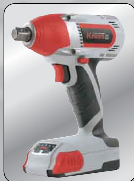
Компактный вариант с аккумулятором 1,5 Ач